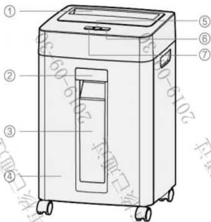
图示仅供参考 具体以实际为准（不同货号形状不同）